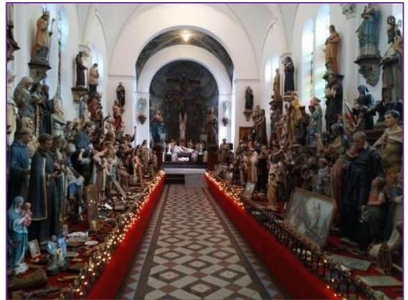
Museum Vaals, vol met heiligenbeelden.

Geloven is beseffen dat de heiligen niet alleen in de hemel wonen, maar zomaar om de hoek.